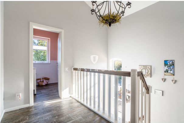
**Kensington_KSH_340_Flur OG Bassum